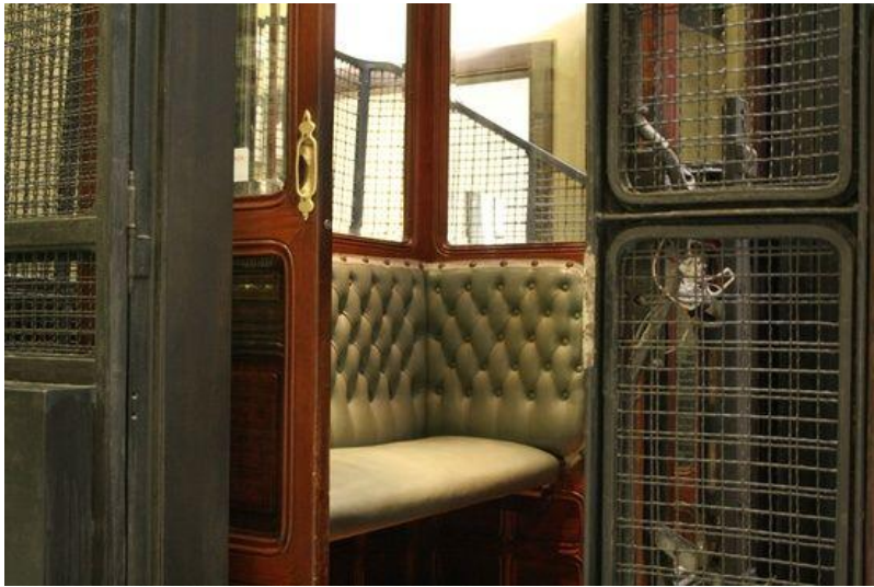
Elevador do século XIX, Barcelona